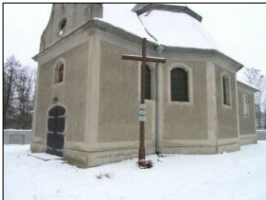
Kościół parafialny w Brzeziu