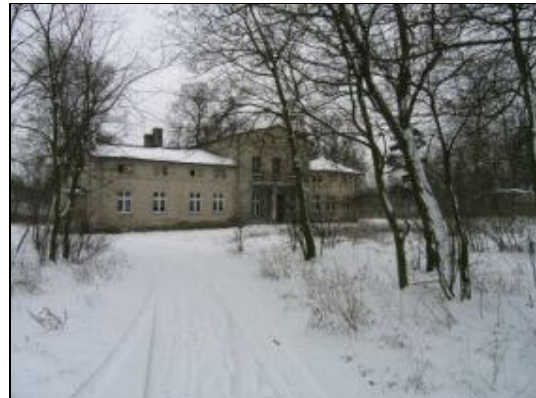
XIX wieczny dwór wraz z parkiem.