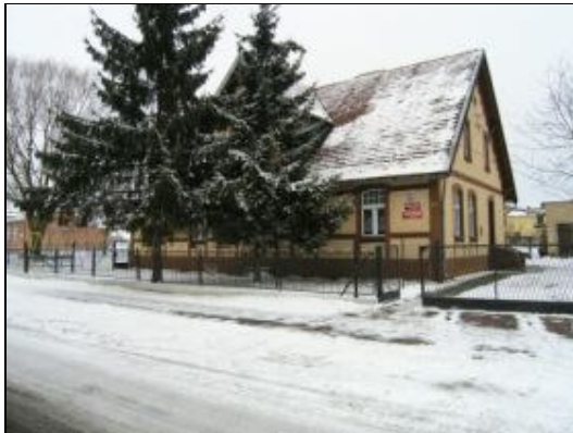
Szkoła filialna w Brzeziu