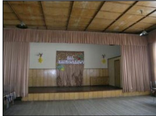
Wnętrze sali wiejskiej