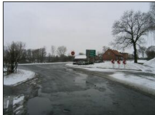
Wyjazd na drogę krajową nr 12