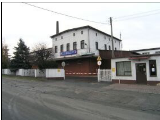
Nowoczesny i największy we wsi zakład - OSM Kowalew