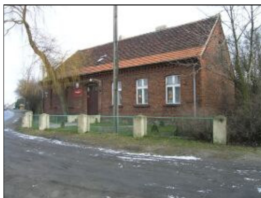
Przedszkole w Kowalewie