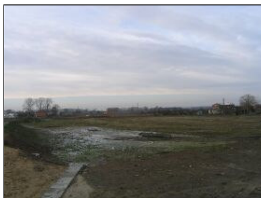
Tereny przyległe do strażnicy – miejsce pod boisko sportowe i rekreacyjne