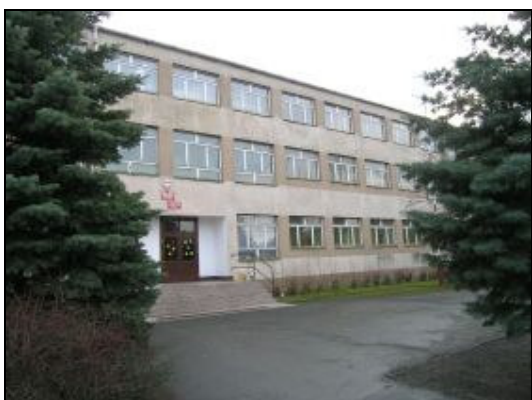
Zespół Szkół Publicznych