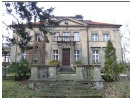
Zabytkowy dwór w Kowalewie