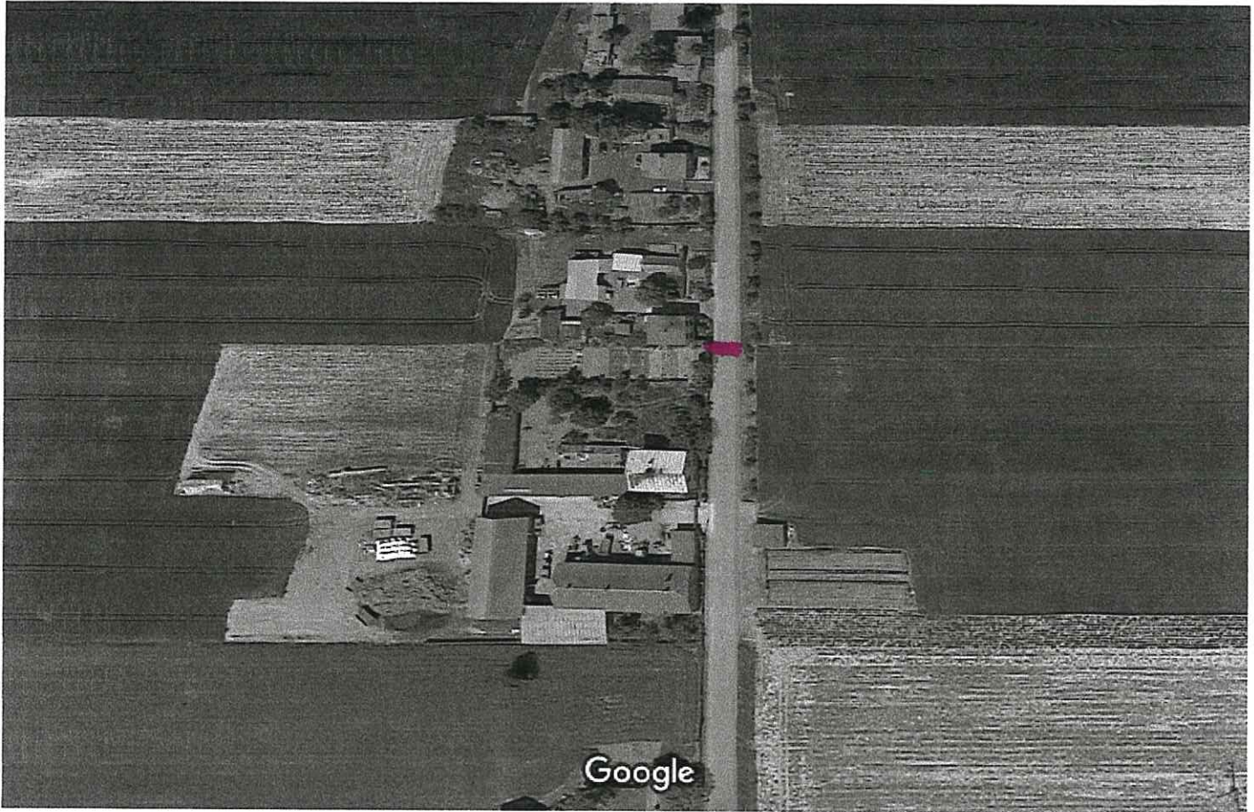
Zdjęcia ©2019 Google, Dane mapy ©2019 20 m

2. Między państwem : Marcińskiem i Kopańskim