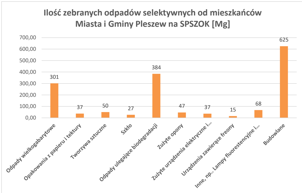
Wykres 3 Ilość zebranych odpadów selektywnych od mieszkańców Miasta i Gminy na SPSZOK w 2023 r.