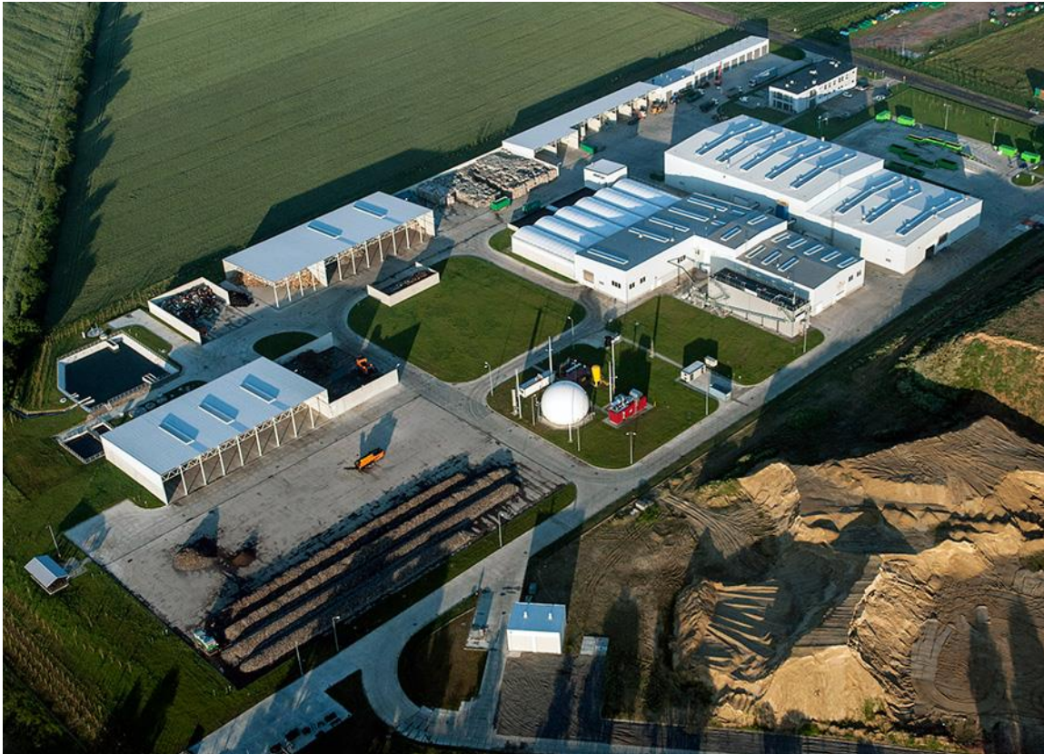
Fotografia 1 Instalacja Regionalna Witaszyczki 1A, 63-200 Jarocin