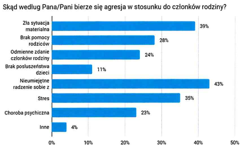
Wykres Nr 3. Przyczyny agresji w rodzinie.