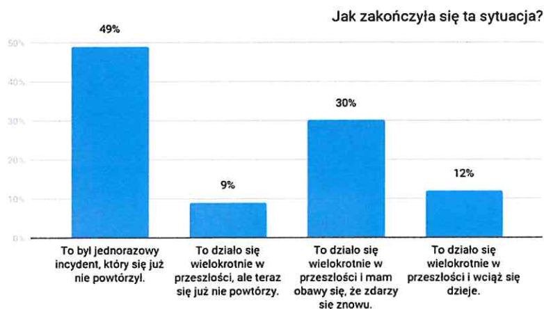
Wykres Nr 2. Opinia na temat rozwiązań sytuacji ze zjawiskiem przemocy.