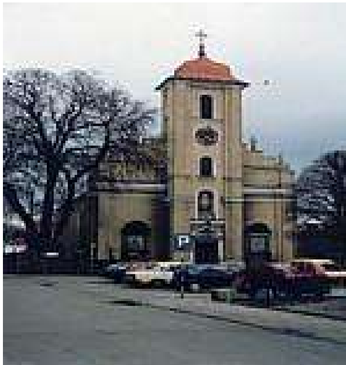
Kościół p.w. Ścięcia św. Jana Chrzciciela (XIV w ).