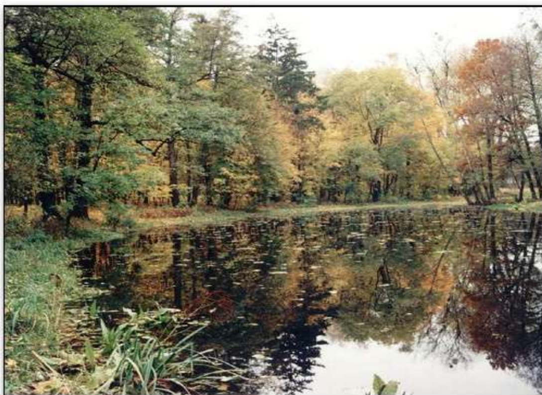
Pleszewski Park Leśny „Planty”

Największym dopływem Prosny jest Ner płynący w szerokiej dolinie rowem o szerokości 1 -1,5 m. Ner jest w zachodniej części uregulowany, na obszarze miasta zaś płynie częściowo krytym kanałem. Ciek ten charakteryzuje się najwyższymi stanami wody w okresie wiosennych roztopów, wtedy niżej położone fragmenty doliny ulegają zalaniu. Na rzece Ner wybudowano suche zbiorniki przeciwpowodziowe. Doliny Prosny, Neru, Giszki, Sobkowiny są miejscami zabagnione.