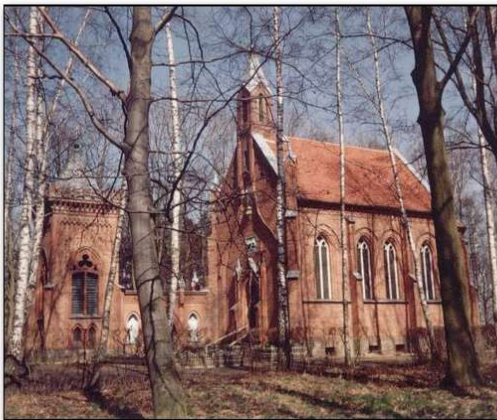
Zespół Pałacowo Parkowy w Taczanowie – neogotycka kaplica – mauzoleum