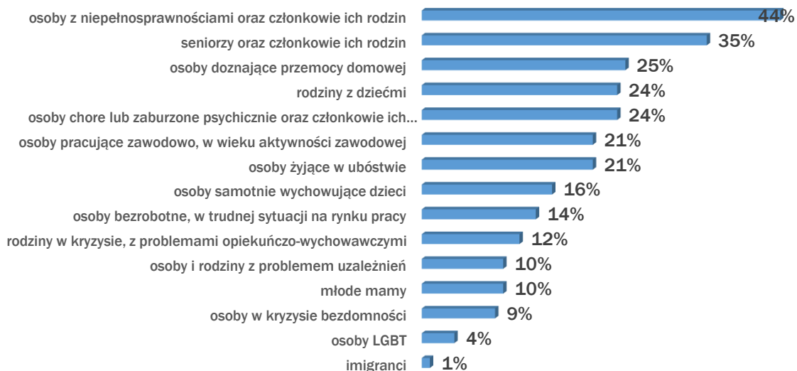
Wykres nr 1. Grupy kategoryjne mieszkańców, do których powinny być skierowane usługi społeczne.