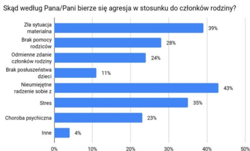
Wykres Nr 3. Przyczyny agresji w rodzinie.