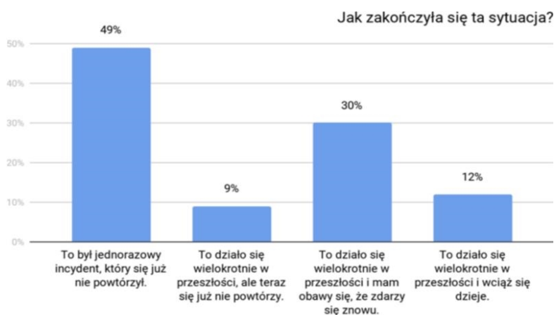
Wykres Nr 2. Opinia na temat rozwiązań sytuacji ze zjawiskiem przemocy.